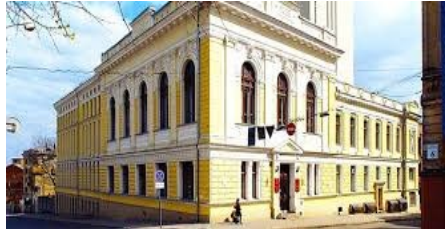
Здание библиотеки им. В. Г. Короленко

северной столицы России, вернулся в Харьков, чтобы создать здесь великолепные архитектурные ансамбли и сформировать мировоззрение будущих архитекторов.